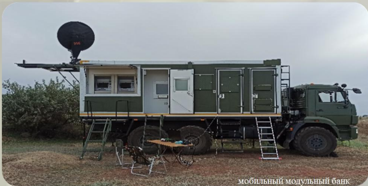
мобильный модульный банк